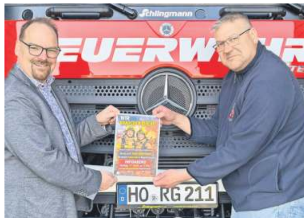
Regnitzlosau: Feuerwehr sucht Quereinsteiger – Infoabend am 17. April